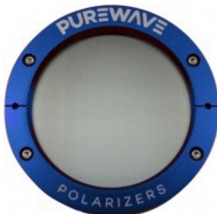
雕刻表示透射光的偏振轴